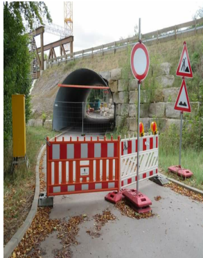
BREITENSPORTWART N. N.